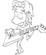
grać na gitarze