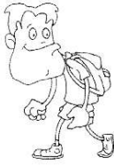
chodzić na spaceru (na siłownię, do kina, do restauracji)