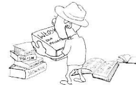
uczyć się języków obcych