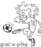
grać w piłkę