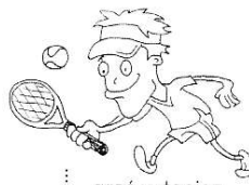
grać w tenisa